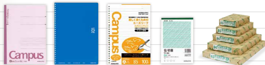
〈主な生産品目〉 無線とじノート・リングノート・ルーズリーフ・複写伝票・コピー用紙など

コクヨグループの主力工場であるコクヨ工業滋賀は、日本一大きな湖「琵琶湖」や山々に囲まれた自然豊かな地で主にコクヨ製品の、 キャンパスノート をはじめとするノートや伝票ルーズリーフ、コピー用紙などの紙製品を生産しています。