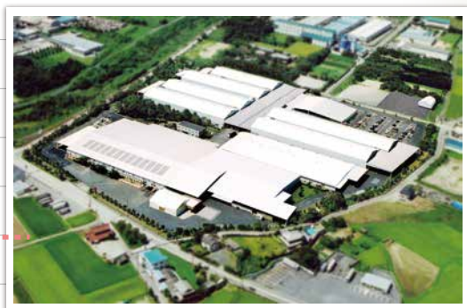
株式会社コクヨ工業滋賀 滋賀県愛知郡愛荘町上蚊野