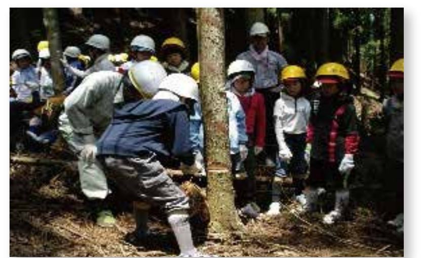
水源林について学ぶ「やまのこ」