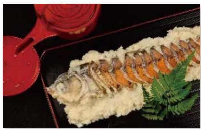
農産物と湖魚のコラボ