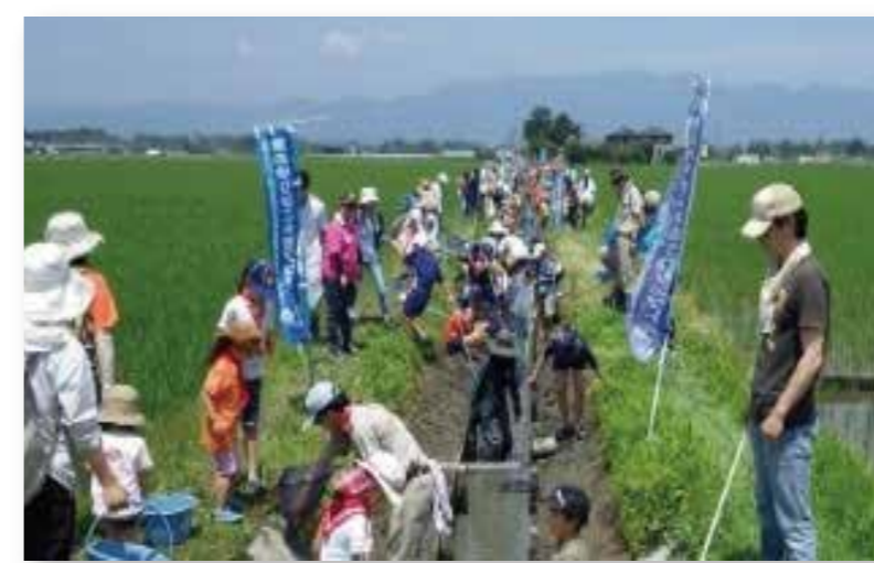
魚のゆりかご水田