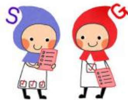
滋賀県健康づくりキャラクター しがのハグ&クミ

ホームページ https://www.pref.shiga.lg.jp/site/nanbyou_center/