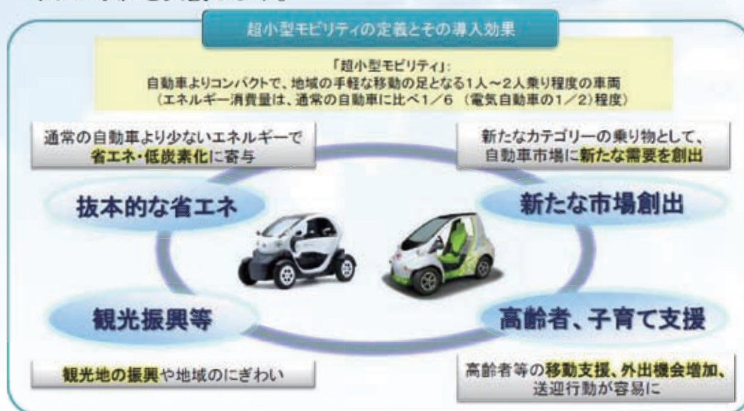
図 3-28 超小型モビリティの定義とその導入効果