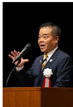
滋賀県知事 三日月大造氏による 主催者挨拶