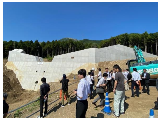
勝山谷川災害関連緊急砂防事業