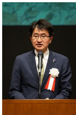
国土交通大臣代理 国土交通省技監 廣瀬昌由氏による 主催者挨拶