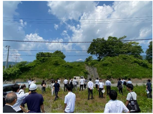
百瀬川天井川切り下げ事業地