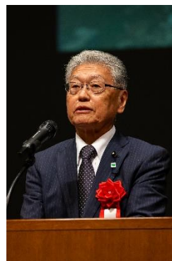
滋賀県議会議長 加藤誠一氏による 来賓祝辞