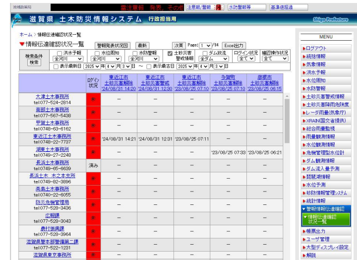
情報伝達確認状況一覧 (SISPAD)