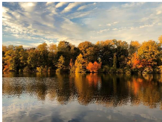
11月のミシガンは日本よりも寒いですが、紅葉の美しさは格別。

偶数年は滋賀県からミシガン州へ、奇数年はミシガン州から滋賀県へ、コロナ禍の中止等はありませんでしたが、団員の相互派遣を続け、今年でなんと50年目を迎えます。