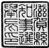
24ミリメートル平方