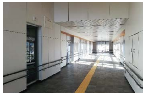
自由通路の整備(石部駅)