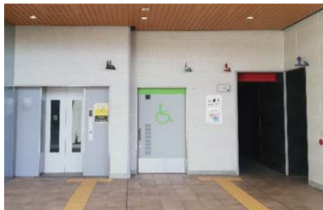
エレベーター・バリアフリートイレの整備(石部駅)

ユニバーサルデザインの理念に基づき、誰もが安心して安全に移動できる交通環境づくりを進めるため、駅のバリアフリー化に向けた取組を推進しています。また、近江鉄道や信楽高原鐵道の施設整備等への支援をしています。