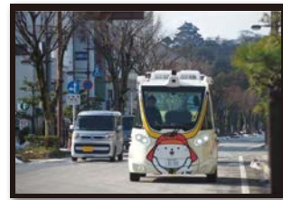
世界遺産登録を目指す「彦根城」周辺ルートで、自動運転バスの実証運行