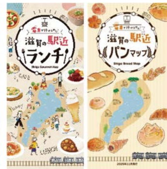
県内鉄道沿線への観光誘客