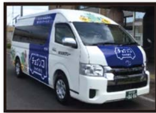
デマンド交通（チョイソコリゅうおう）