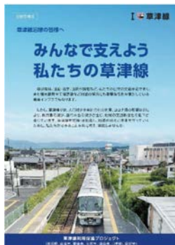
沿線住民への利用促進

地域を支える鉄道の利便性向上を図るため、関係市町等と連携して、地元住民の鉄道利用促進や観光誘客等の取組を進めています。