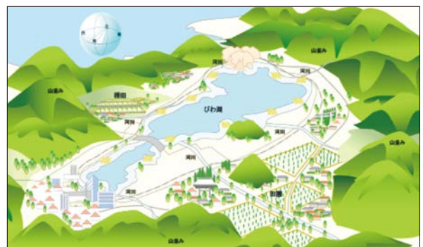
守り育てたい“ひろがり”と“つながり”の風景

また、景観に大きな影響を及ぼす屋外広告物のあり方について連絡調整を行うため、県と全市町が参加する「滋賀県屋外広告物連絡会議」を設置し、屋外広告物の安全性の向上等適正化に向けた取組を進めています。