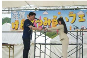
若手・女性技術者の活躍を表彰