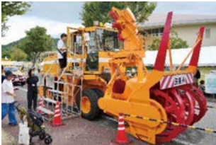
官民が連携したイベントの開催 ～滋賀けんせつみらいフェスタ～

建設産業の担い手が減少していることから、若者に建設産業の魅力を伝える出前授業や『滋賀けんせつみらいフェスタ』の実施、男女問わず働きやすい環境であることを伝える広報動画の制作など、官民が連携して、担い手確保・育成に関する施策を進めています。また、YouTubeを活用した動画配信やX、InstagramなどのSNSにより、建設産業の魅力を広く発信しています。