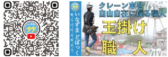
楽しいにふれよう いはずまどぼっく SNSを活用した動画配信による魅力発信