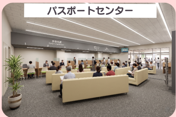
パスポートセンター