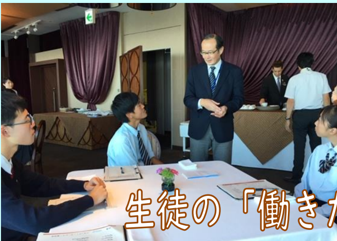
生徒の「働きたい」を応援する