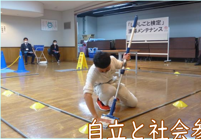
自立と社会参加をめざして