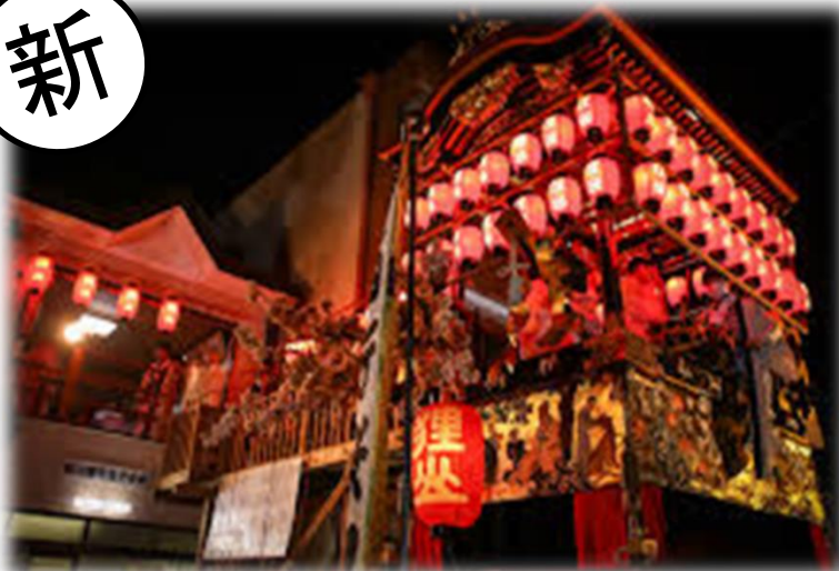
大津祭 宵宮ガイドツアー(大津市)