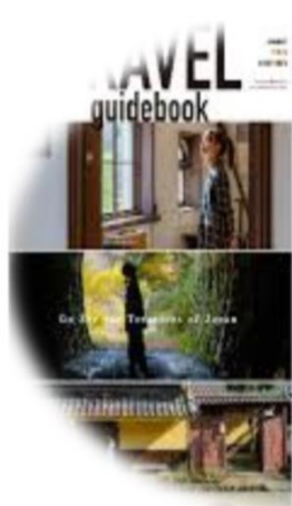
長浜市× 敦賀市×南越前町 (鉄道遺産を巡る旅)

情報提供のあった観光コンテンツ・シガリズム体験から掲載。新規コンテンツは検討中のものを含む