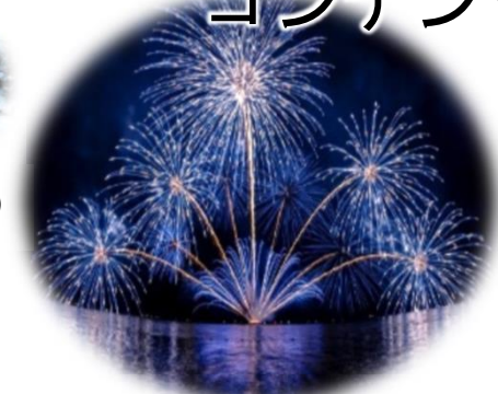
オリジナル催事花火 びわ湖玉「湖風(こふう)」と 「淡海(おうみ)」(大津市×守山市)