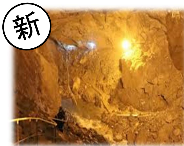
地底から星座まで 多賀で学ぶ地学ツアー(多賀町)