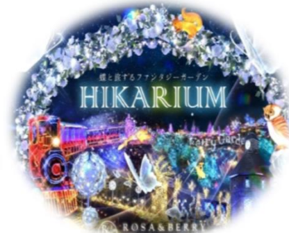
関西最大級のイルミネーション！ 「HIKARIUM2026」 (米原市)