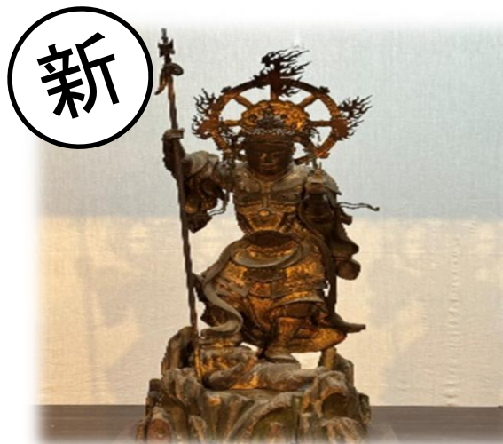
西明寺 宝冠毘沙門天像特別公開・ 本堂後陣仏像群特別拝観(甲良町)