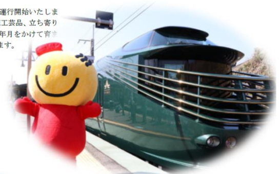
おごと温泉駅にて

2026年3月～6月出発分[第28期]から琵琶湖を巡る新しいコースを運行開始いたします。新コースでは琵琶湖を臨む車窓、滋賀ゆかりの食事や車内を彩る伝統工芸品、立ち寄り観光などをお楽しみいただけます。日本最大の湖、琵琶湖をはじめ長い年月をかけて育まれてきた滋賀の風景・歴史・文化を「瑞風」の旅を通じてお伝えいたします。