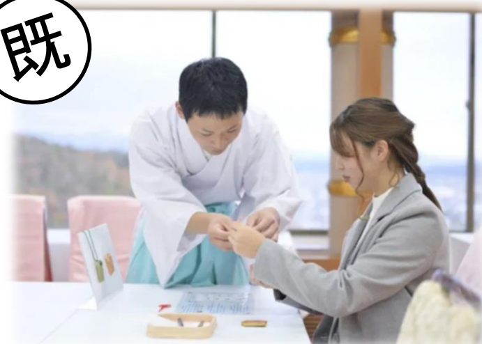
近江の麻織物で作る“特別なお守り”(東近江市)