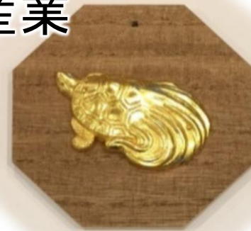
彦根仏壇 工房見学&工芸体験ツアー (彦根市)