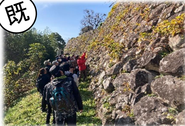
彦根城石垣探検(彦根市)