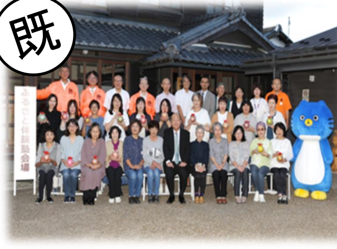
伝統工芸品びんてまり ふるさと体験塾(愛荘町)