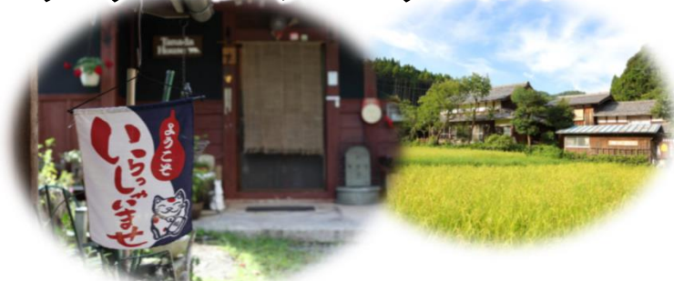
「暮らす」ように「泊まる」 昭和レトロな「農家民宿」(高島市)