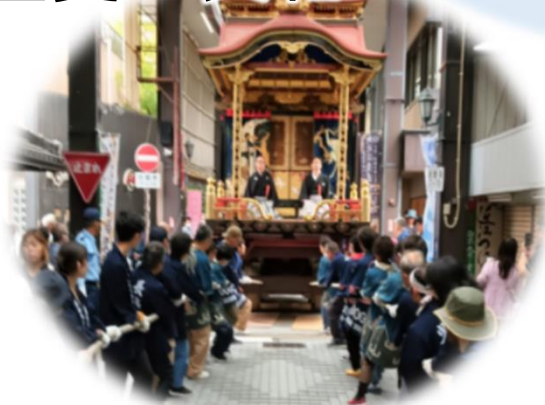
長浜「秋の曳山巡行」山曳き体験 (長浜市)