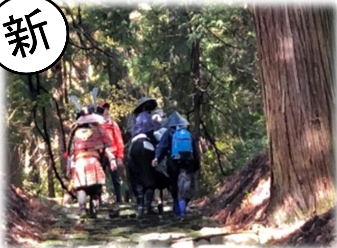
【京極家】から始まる米原 ～地元ガイドと歩く城下町(米原市)