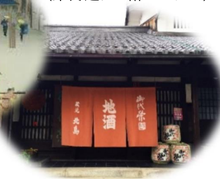
草津市×栗東市×湖南市