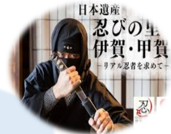
甲賀市×三重県上野市 (忍びの里巡りツアー)