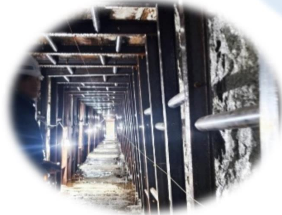
大津市×栗東市×甲賀市 (鉄道遺産を巡る旅)