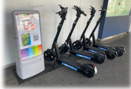
電動キックボード