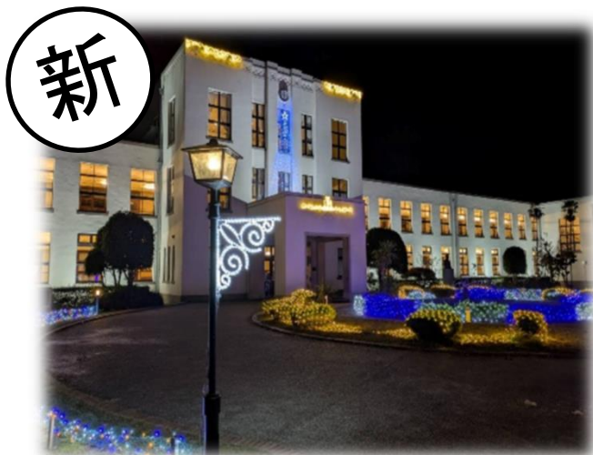
ナイトスクール 白亜の校舎夜間見学 (豊郷町)

情報提供のあった観光コンテンツ・シガリズム体験から掲載。新規コンテンツは検討中のものを含む