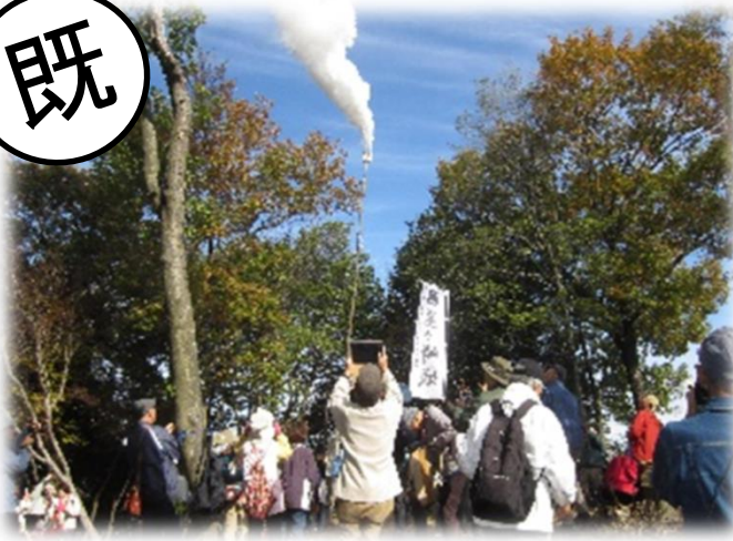
琵琶湖一周のろし駅伝(竜王町)