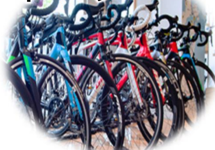
びわ湖岸地域自然体感 サイクリングプラン(守山市)