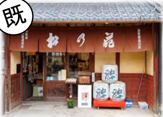
日本遺産の”かばた”に構える日本酒とウイスキーの蔵元体験とシガリズム体験(高島市)