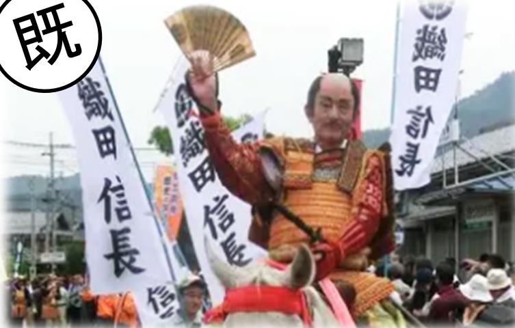
あづち信長まつり(近江八幡市)