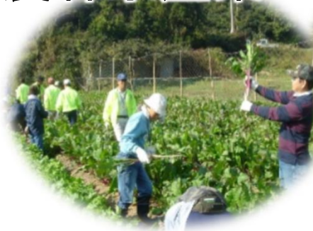
原産 日野菜体験 (日野町)