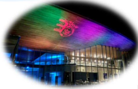
琵琶湖博物館ナイトミュージアム (草津市)