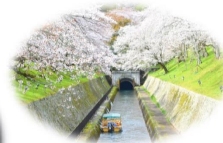
滋賀県×京都市 (琵琶湖疏水船特別運行)