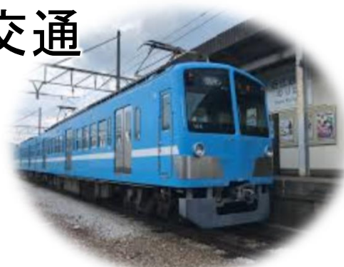
近江商人の食文化を味わうグルメトレイン (東近江市×日野町×近江鉄道)