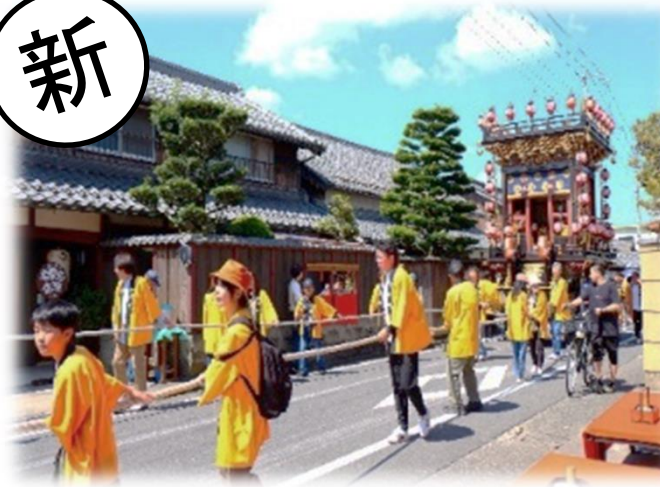
日野祭 絢爛豪華な曳山体験 (日野町)