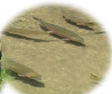
ニジマスのエサ釣り体験 (米原市)