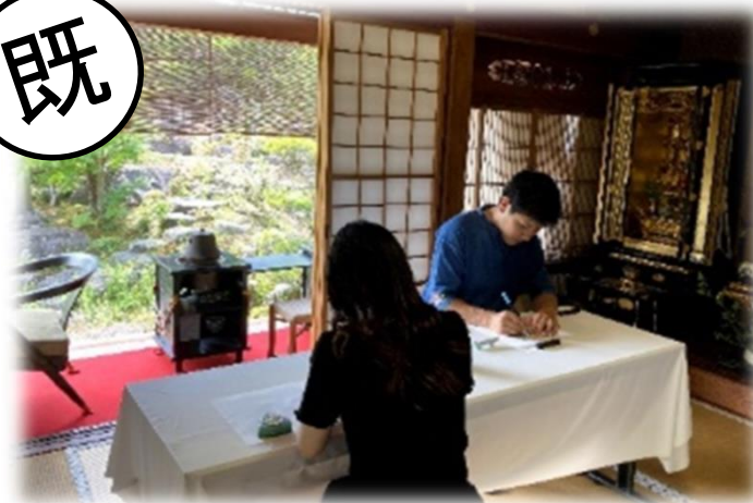
隠れた名園(枯山水)鑑賞と写経・お抹茶点て体験(湖南市)