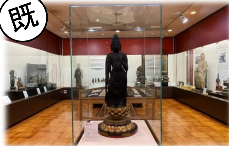
長浜観音堂高月別院(長浜市)