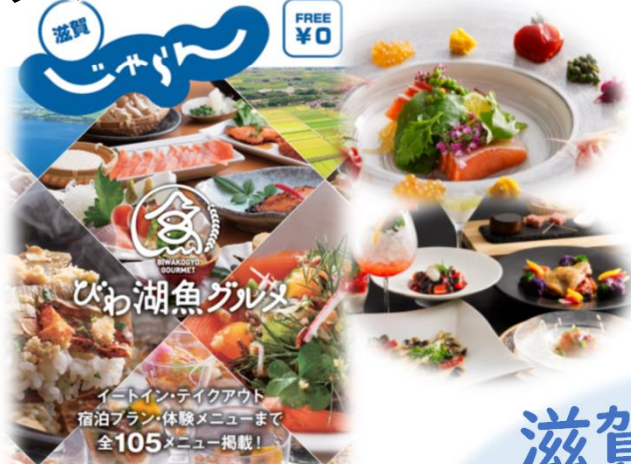
びわ湖魚グルメ (滋賀県)