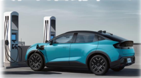
次世代自動車レンタカー