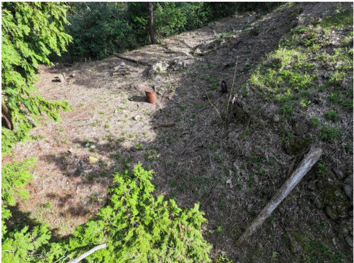
写真1 III区の現況 (南西から)