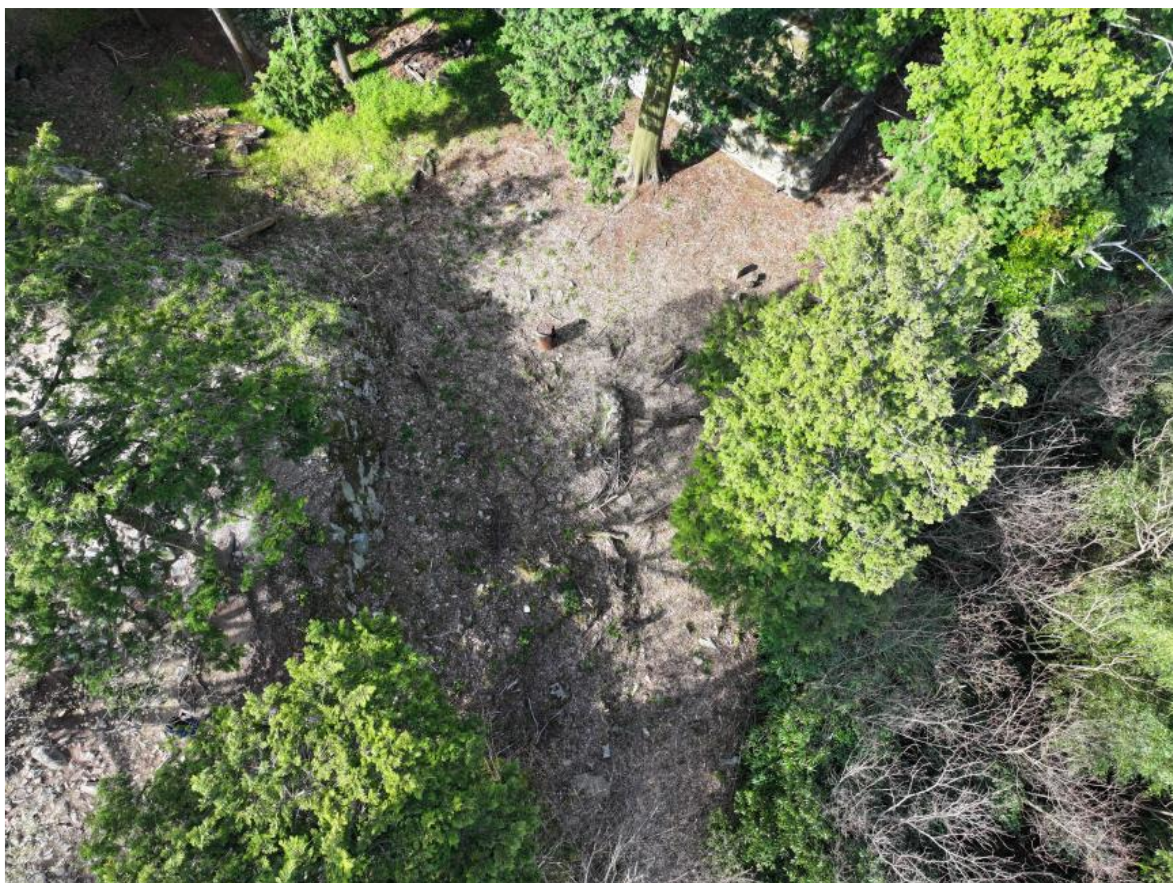
写真2 Ⅲ区の現況（北東から）