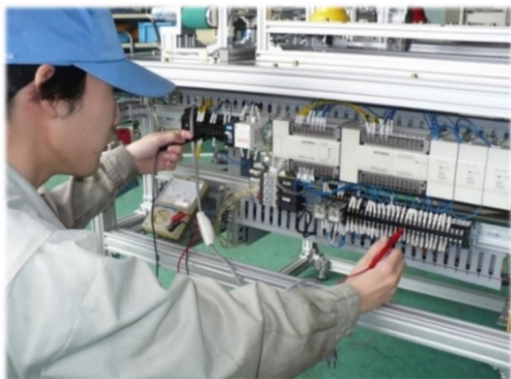
メカトロニクス科

※ 開催日当日に熱や咳などの風邪の症状がある場合、テクノカレッジに連絡の上、参加をご遠慮ください。