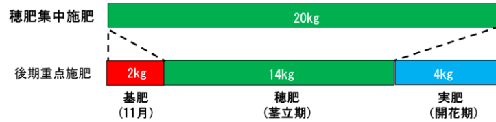
図1 穂肥集中施肥技術と後期重点施肥技術の比較