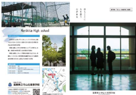
改訂版学校パンフレット