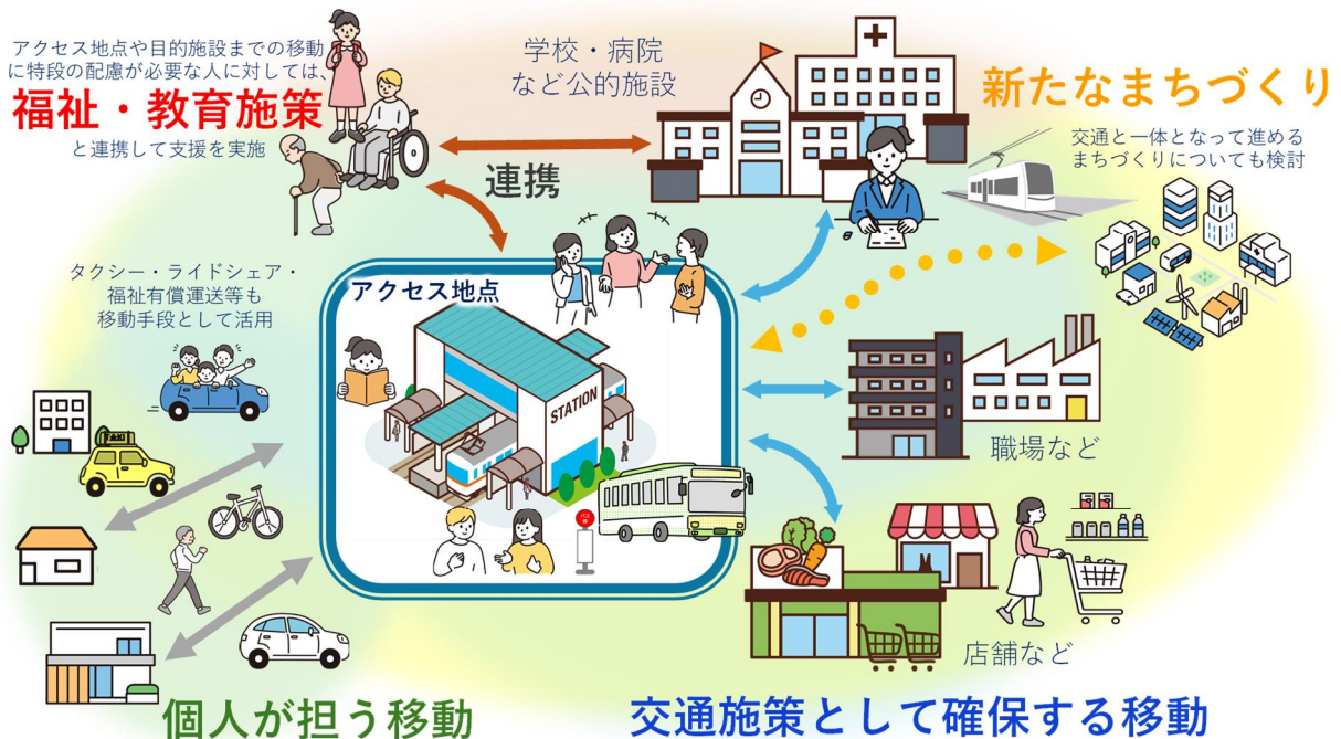
図 4.2 移動における役割分担のイメージ

なお、徒歩や自転車、自家用車による移動等の各個人が担う移動についても、地域交通のアクセス地点までの重要な移動であり、より便利で安全が確保されるよう、関係部局の各種計画と連携しながら取り組みます。