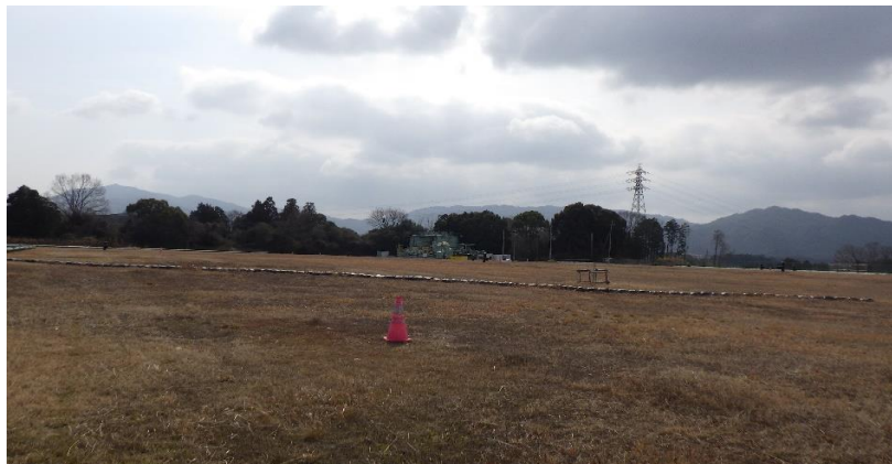
写真① 天端部の様子