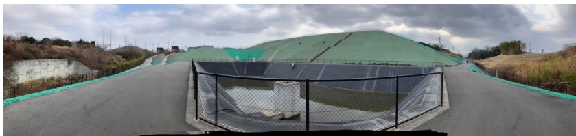
写真② 調整池付近の様子