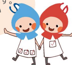
滋賀県健康づくりキャラクター しがのハグ&クミ

令和7年度の健康づくりサポーター通信は、今月号で最後になります。次年度もどうぞよろしくお願いいたします。