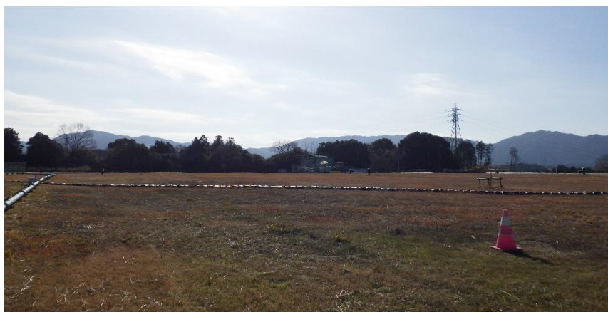
写真① 天端部の様子