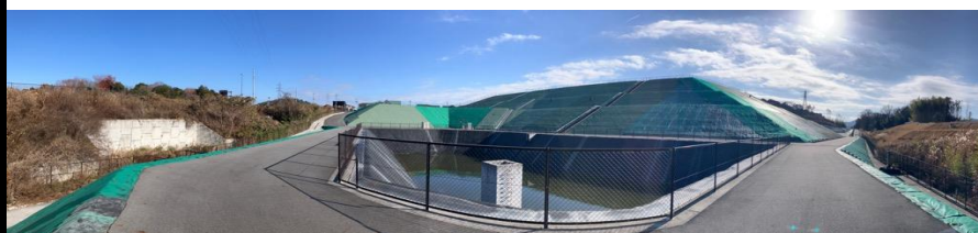
写真② 調整池付近の様子