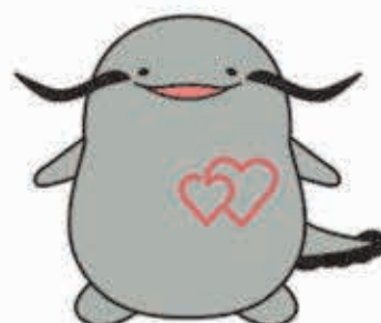
滋賀県立総合病院 マスコットキャラクター びわずん