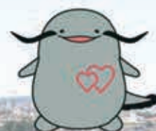
滋賀県立総合病院 マスコットキャラクター びわすん

研修医・看護実習生等が、臨床実習・臨床研修の一環として、診療行為に加わる場合がありますが、次世代を担う医療人育成のため、ご理解のうえご協力をお願いいたします。