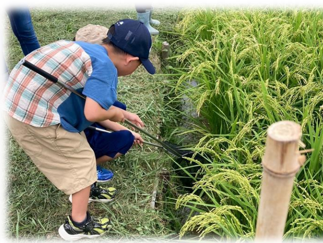
老上ふれあい農業高校