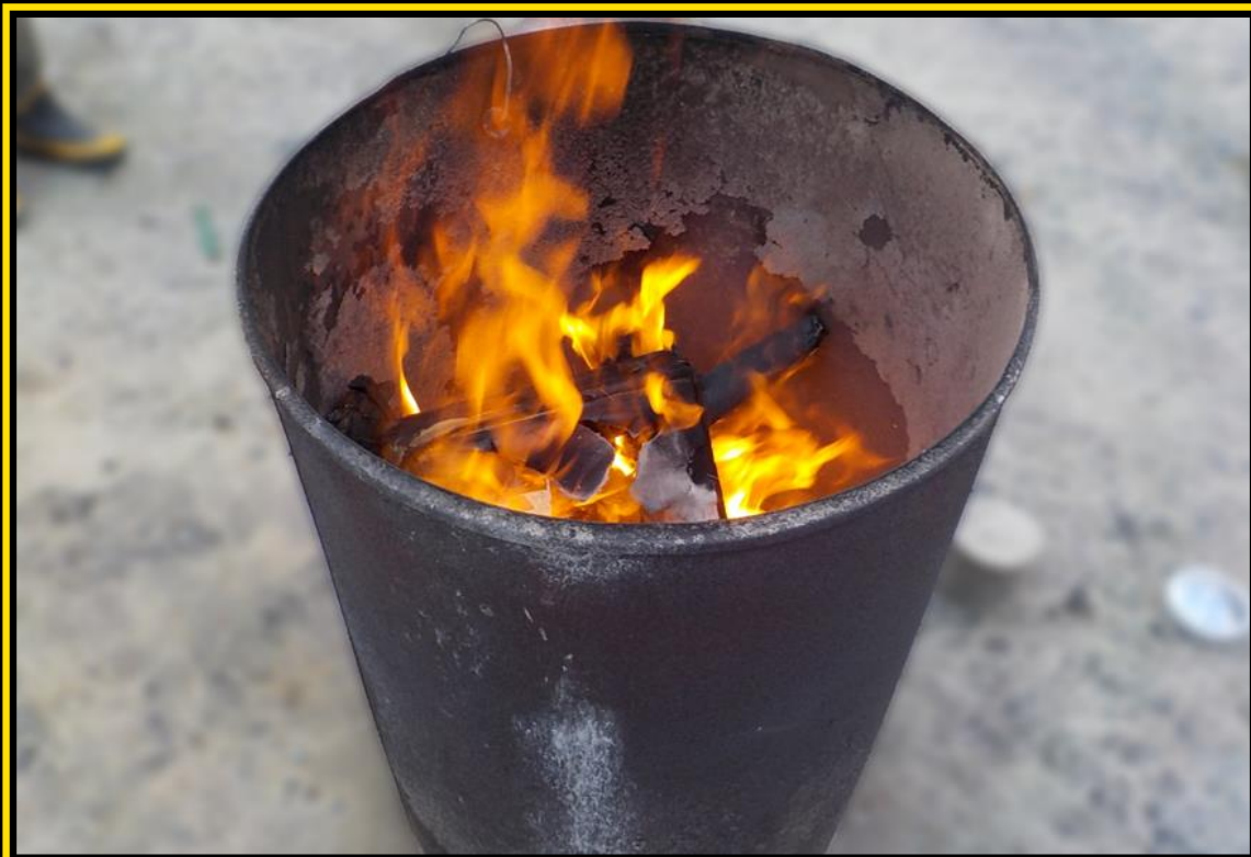
드럼통을 이용한 소각