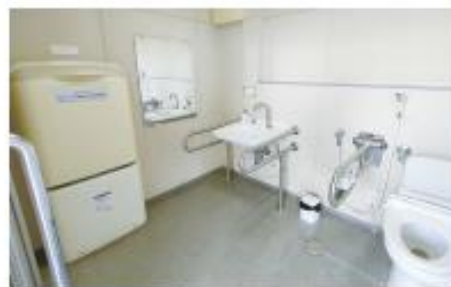
バリアフリートイレ（南駐車場側）