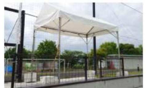
申いず観覧席（Cコート）