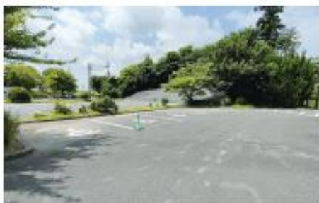
申いず駐車場（南駐車場）