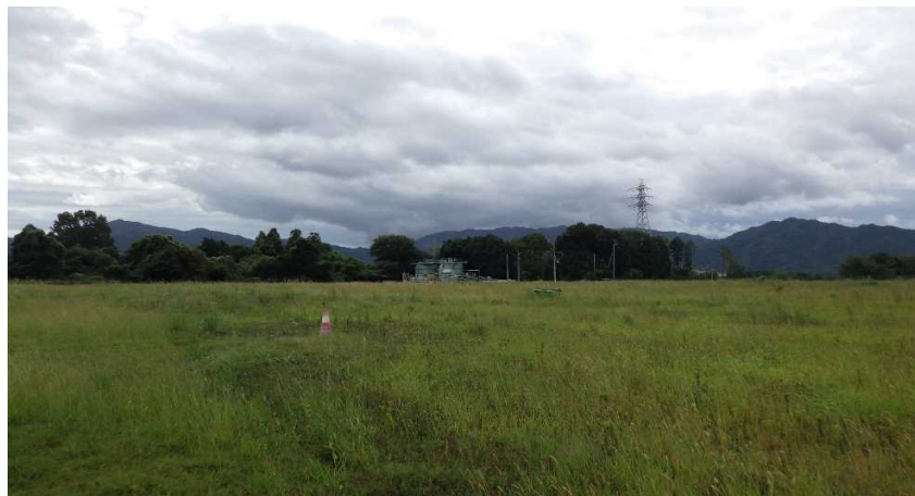
写真① 天端部の様子