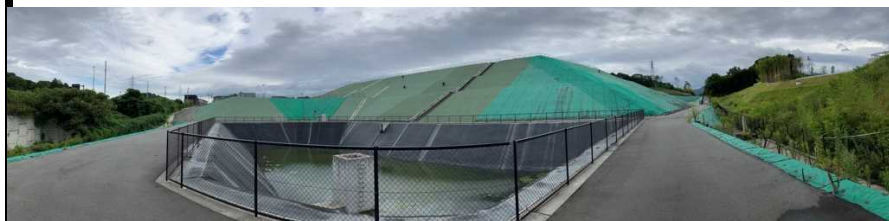
写真② 調整池付近の様子