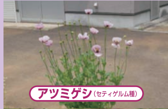
アツミゲシ(セティゲルム種)

花びらは4枚で、色は赤、桃、紫、白などがあります。また、多数の花びらがついた八重咲きの花もあります。