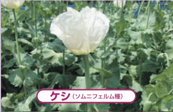
ケシ(ソムニフェルム種)