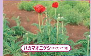
ハカマオニゲシ(アラケテウム種)