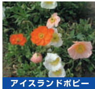
アイスランドポピー