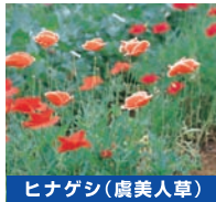
ヒナゲシ(虞美人草)