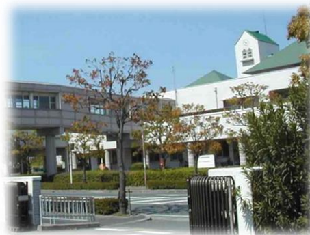
病院と校舎を結ぶ陸橋『ほほえみの橋』