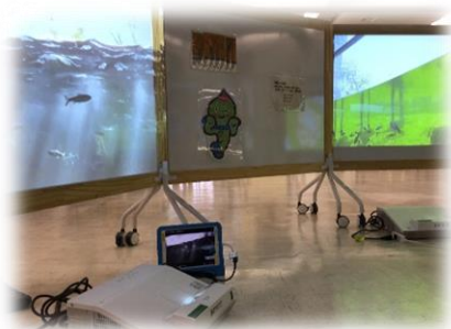
校舎内に ミニ博物館を再現『びわこタイム』