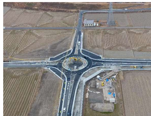
岡ラウンドアバウト