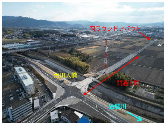
治田大橋およびバイパス