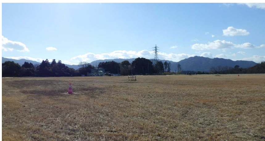
写真① 天端部の様子