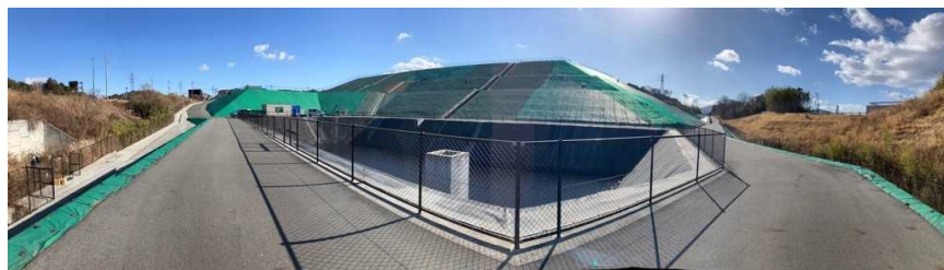
写真② 調整池付近の様子