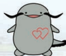
病院マスコットキャラクター びわずん

研修医・看護実習生等が、臨床実習・臨床研修の一環として、 診療行為に加わる場合がありますが、次世代を担う医療人育成のため、 ご理解のうえご協力をお願いいたします。