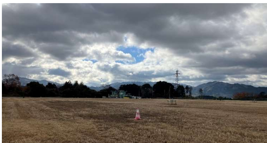
写真① 天端部の様子