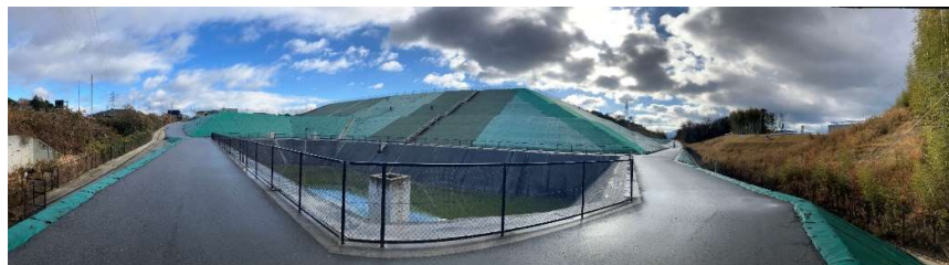
写真② 調整池付近の様子