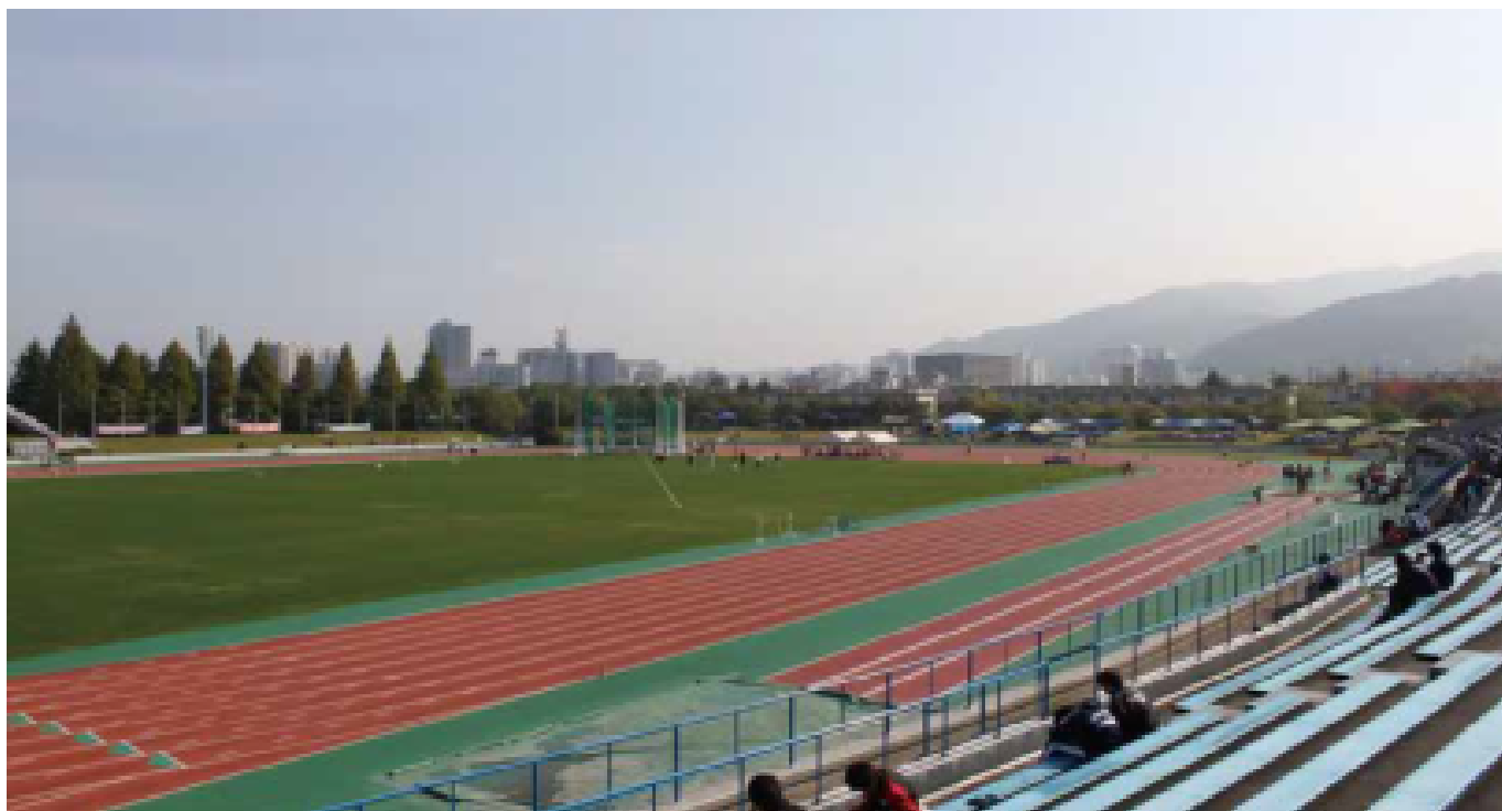
〈皇子山陸上競技場〉