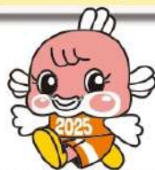
2025わたSHIGA輝く国スポ・障スポ マスコットキャラクター チャップイー