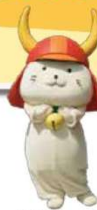
彦根市 彦根市キャラクター ひこにやん