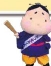
大津市イメージキャラクター おおつ光くん