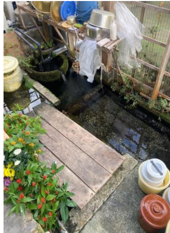
建物の中にあるかばた