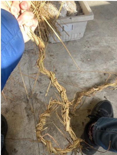
しめ縄作りに挑戦

手ですり合わせるようにして、藁を編んでいった。きれいに編むのがとても難しかった。