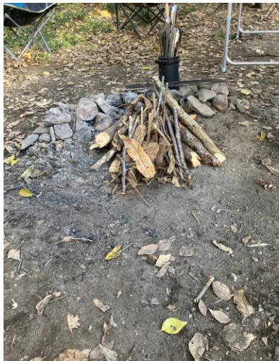
焚火の仕方を学ぶ