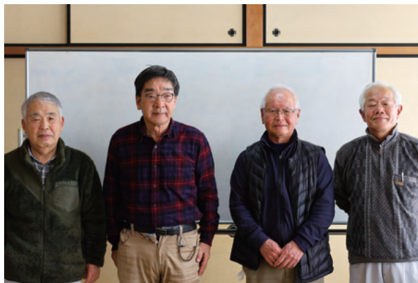
「上野自治会農業活性化プロジェクト」