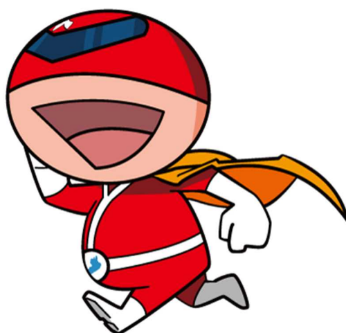
滋賀県人権啓発キャラクター ジンケンダー