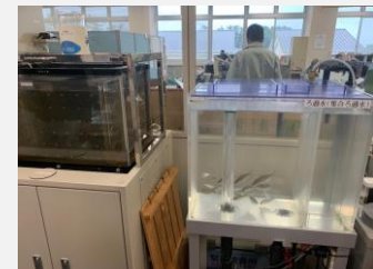
企業庁浄水課第一の試験室で飼育されている魚

企業庁の検査室には魚が泳ぐ水槽があります。鑑賞用？非常食？魚たちはどのような役割を担っているのでしょうか。