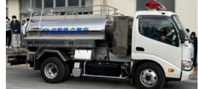
↑被災地支援等で使用する給水車↑

これまで自分が上司にもなったように、一緒に行動するなかで経験を伝え、技術継承をしていきたいです。現場に行って自分の目で見て、触れることが大切で、柔軟な発想で水道事業に向き合ってほしいです。