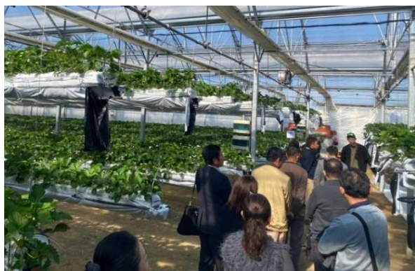
イチゴ栽培施設の見学

当課では、今後も、指導農業士の担い手育成活動だけでなく、世代を超えた生産者同士の交流を進め、地域農業の発展に向けて支援していきます。