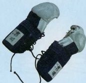
剣道用の籠手