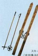
スキー板とストック