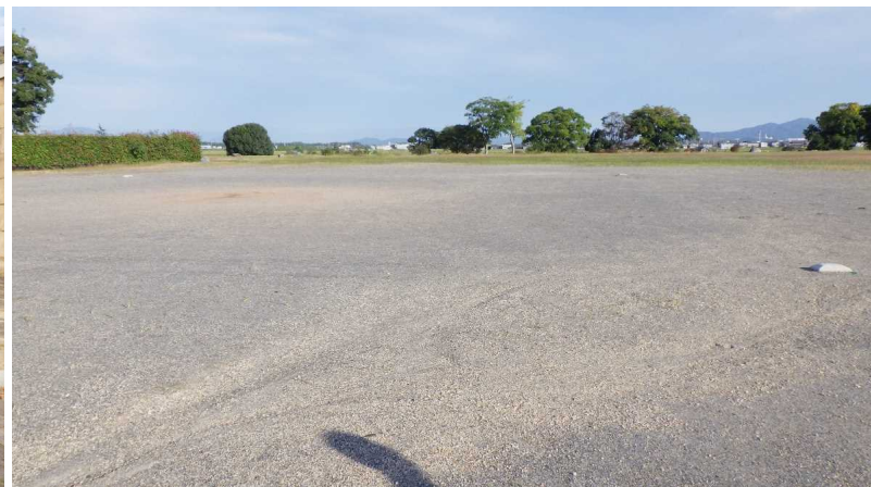
運動場(グラウンド)