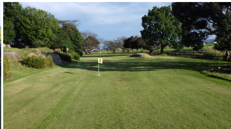
グラウンドゴルフ場