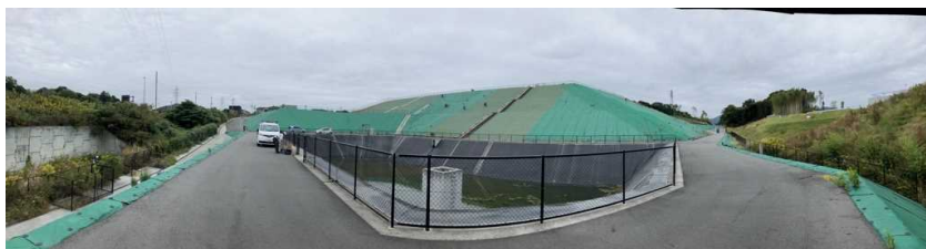
写真② 調整池付近の様子