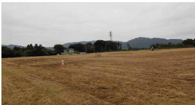
写真① 天端部の様子