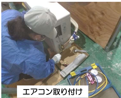
エアコン取り付け