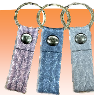
反射キーホルダー ※ランダムで一色