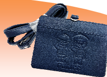
警察柄カードケース (ストラップ付き)