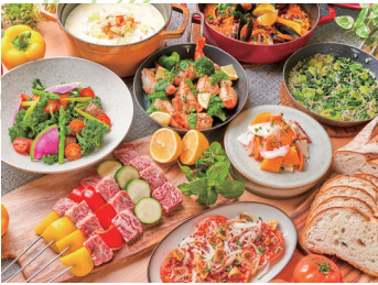
豪華アウトドアディナーコース

新しい宿泊の形「グランピング」施設として、2017年6月より開業。グランピング施設では初となるオールインクルーシブ制を導入、食事のサーブから後始末までスタッフが行き、何もしない贅沢を心ゆくまで堪能できるリゾート施設です。