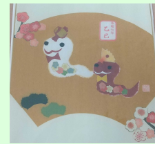
ちぎり絵(イメージ)