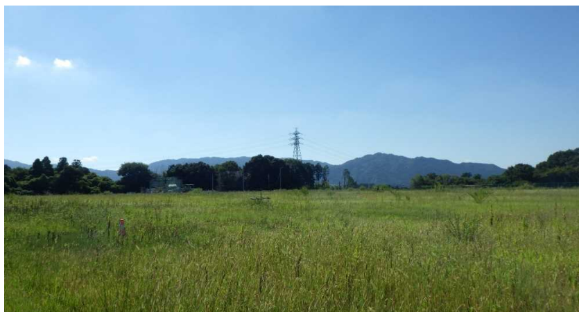
写真① 天端部の様子