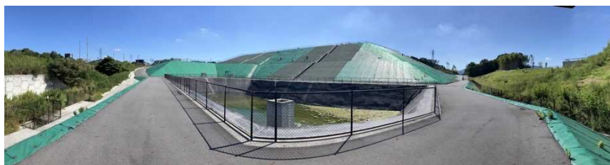
写真② 調整池付近の様子