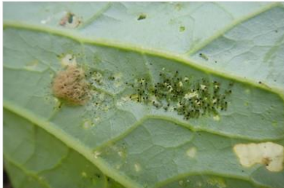
写真 ハスモンヨトウ幼虫によるキャベツの加害