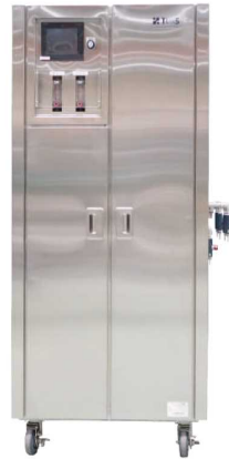
衛生用電解水生成装置 「TIWS-HM」