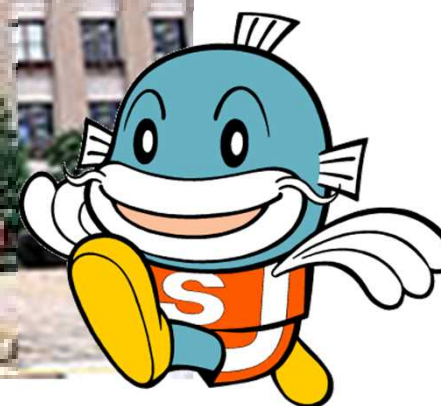
滋賀県イメージキャラクター 「キャツフィー」